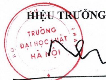
Đoàn Trung Kiên